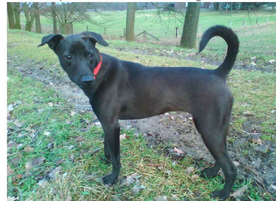
"Cloe" heute : Ein glücklicher, gesunder Hund

Das Team von Euro-P. A. S. sieht dem neuen Jahr erwartungsvoll und optimistisch entgegen. Viele Tiere warten auf Hilfe und das Team wird sich bemühen, diesen Tieren genauso kompetent und mit Herzblut zur Seite zu stehen wie im Jahr zuvor.